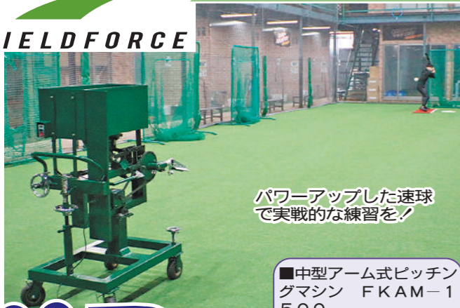
パワーアップした速球で実戦的な練習を!

■中型アーム式ピッチングマシン FKAM-1500 ◇サイズ 高さ約138㌢×幅約60㌢×奥行き約90㌢ ◇重量 約134kg ◇材質 スチール ◇使用電源 AC100V 50/60Hz ◇価格 55万円 (税抜き)